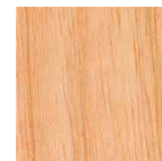
Unbehandelt (ohne Melaminüberzug)

Wir verfügen über eine große Auswahl von Echtholz-laminaten, zum Beispiel Esche, Walnuß, Kirsche, Eiche, Buche, Teak, Sycamore, Zebrano, Wenge, Bambus, Palisander sowie zahlreiche andere.